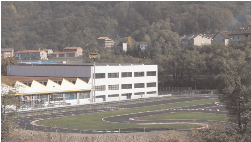
Lo stabilimento di Ronco Scrivia

Nel 2010, l'azienda ha fatto il suo ritorno ufficiale nel massimo campionato di Formula 1, siglando importanti accordi di partnership con Renault F1, Scuderia Toro Rosso e HRT per la fornitura di attrezzature di sicurezza per le monoposto ed equipaggiamento tecnico per piloti e meccanici.